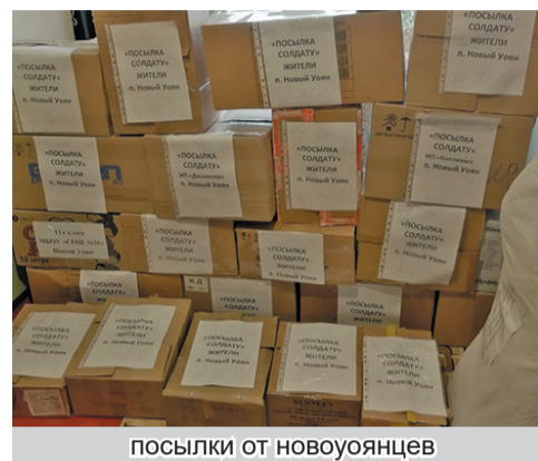
посылки от новоуоянцев

Все свои посылки мы отправляем ребятам адресно, так как в рядах бойцов СВО на страже границ нашей Родины есть новоуоянцы. На днях мы получили письмо с благодарностью от бойца Сыроедина Николая.